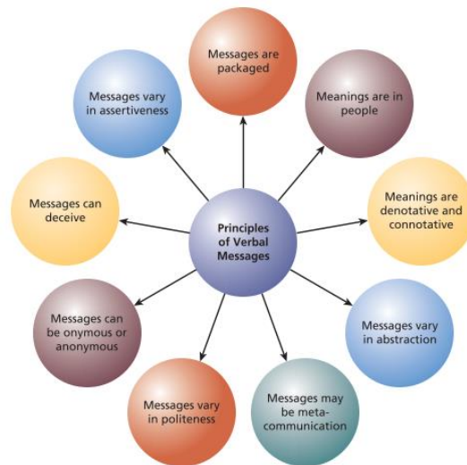
Gambar 2. 1 Sembilan Prinsip Pesan Verbal.