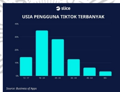
Gambar 1. 2 Data Usia Pengguna TikTok

angka tersebut meningkat sebanyak 19,1 persen jika dibandingkan dengan pengguna TikTok di Indonesia pada bulan Oktober 2023 yang hanya mencapai 105,52 juta pengguna (We are Social). Usia pengguna media sosial TikTok diungguli oleh usia 18 – 24 tahun kemudian disusul dengan usia 24 – 34 tahun. Data dari hasil Sensus Penduduk oleh BPS pada 2020 menunjukkan bahwa pada saat ini Indonesia didominasi oleh Generasi Z dengan persentase sebesar 27.94% atau sebanyak 75.49 juta jiwa. Istilah Generasi Z diperuntukan bagi generasi yang termasuk dalam kategori tahun lahir 1995-2010, hal ini berdasarkan penelitian yang dilakukan oleh Bencsik, Csikos, dan Juhes (2016) yang menunjukkan bahwa masuknya Generasi Z kedalam kelompok generasi adalah pada tahun 1995-2010 (Putra, 2016).