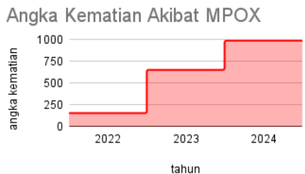
Gambar 2.3 Data Angka Kematian Akibat MPOX di RDK dari tahun 2022-2024

mana jumlah kasus suspek mencapai puncaknya dengan 30.000 kasus 81 . Faktor-faktor seperti urbanisasi, pertumbuhan populasi, dan tantangan dalam pengelolaan kesehatan masyarakat turut berkontribusi terhadap peningkatan tajam ini. Selain melihat jumlah kasus suspek, penting juga untuk memahami dampak yang lebih serius dari MPOX, yaitu angka kematian yang terjadi akibat penyakit ini. Data kematian selama tahun 2022 hingga 2024 dapat membantu memberikan gambaran seberapa parah wabah ini menyerang, sekaligus menunjukkan tantangan yang dihadapi dalam upaya pengendalian dan penanganannya. Berikut adalah angka kematian akibat MPOX selama periode tersebut: