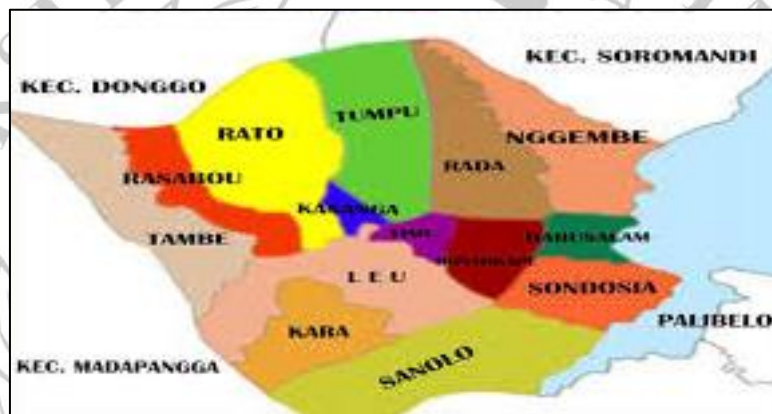
Gambar 4.1 Peta Kecamatan Bolo

Penelitian ini dilakukan di Desa Leu, Kec. Bolo, Kab. Bima, Provinsi NTB. Data yang digunakan adalah data administrasi, Desa Leu terletak di sepanjang Jalan Lintas Sumbawa, berjarak sekitar 1 km dari pusat Kecamatan Bolo, Kabupaten Bima, NTB. Pemukiman ini memiliki permukaan datar, kemiringan 0%, dan ketinggian 30 meter di atas permukaan laut.