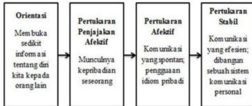
• Gambar 2.3 Tahapan Penetrasi Sosial, (West, 2012)

Tahap Orientasi ( Orientation Stage ): Membuka Sedikit Demi Sedikit interaksi awal terjadi di tingkat publik. Pada titik ini, hanya sedikit dari kita yang terbuka pada orang lain. karena selama proses komunikasi hanya memberikan informasi dasar.