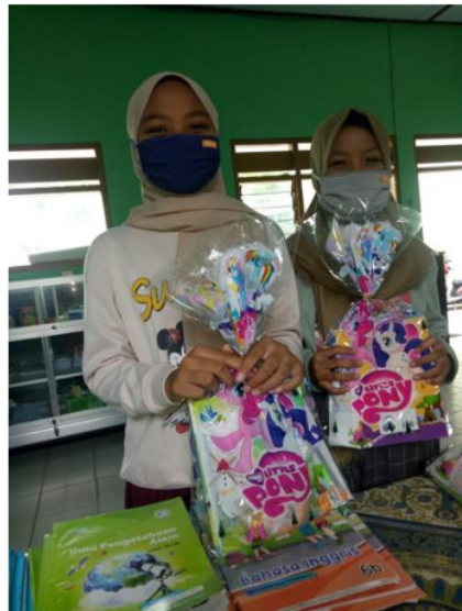
Gambar 7. Penyerahan hadiah kepada salah satu siswa