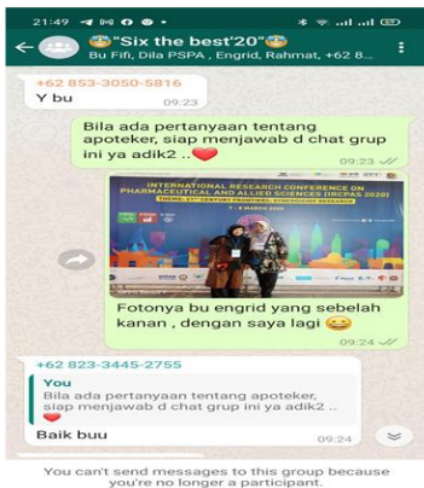
Gambar 2. Perkenalan tim pengabd