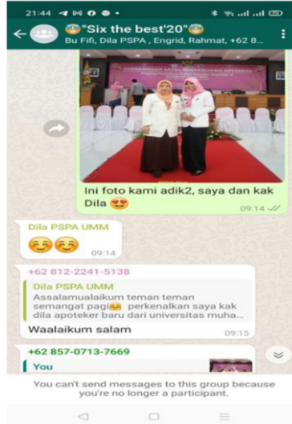
Gambar 3. Perkenalan Profesi Apoteker kepada siswa