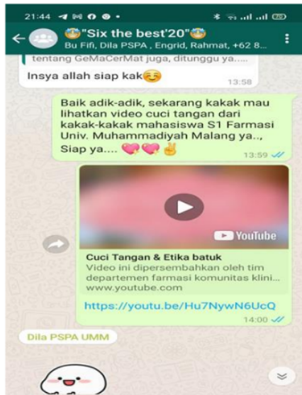
Gambar 5. Materi Cuci Tangan dan Etika Batuk