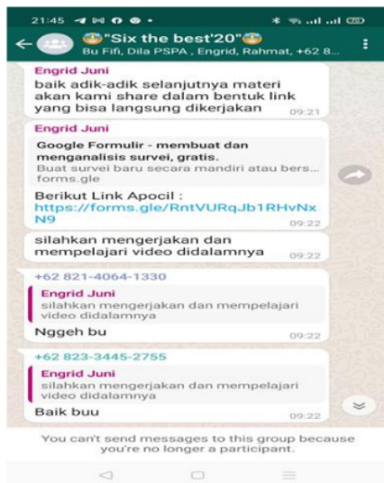
Gambar 6. Pretes dan Postes