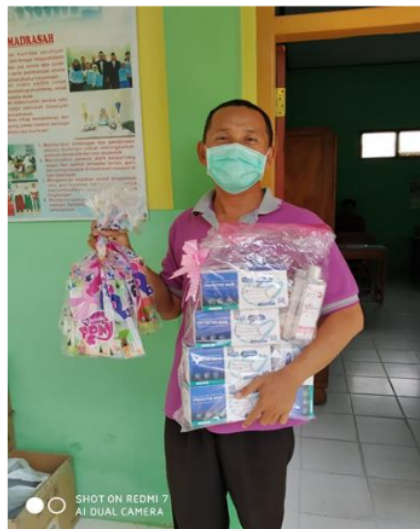
Gambar 8. Penyerahan kenang-kenangan kepada pihak sekolah