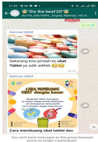
Gambar 4. Pemberian materi tentang pengenalan Obat