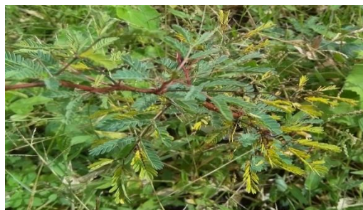
Gambar 1. Daun sampel yang diberi perlakuan ( Treated sample leaves )

Sampel dengan perlakuan K3L0 mulai menunjukkan ciri akan mengalami kematian yaitu pada pengamatan hari ke-30 (pengamatan ke-3), di mana daun sampel mulai layu atau kekuningan, hingga pengamatan hari ke-40 (pengamatan ke-4) sampel telah benar-benar mati ditandai dengan sampel yang daunnya berubah menjadi kecokelatan atau mengering dan gugur (Gambar 2). Sampel yang digunakan mengalami dampak yang sama antara yang terjadi pada ulangan 1 sampai dengan ulangan 3.