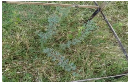
Gambar 3. Kondisi A. nilotica (L.) Willd. yang tidak mengalami kematian ( Conditions of A. nilotica (L.) Willd. after treated )

yang digunakan masih dalam tingkatan hidup semai. Tanaman yang masih dalam tingkat hidup semai pada umumnya akan memiliki diameter yang konstan hingga tanaman memasuki tingkat hidup pancang. Tanaman yang masih dalam kondisi semai akan berfokus menumbuhkan tinggi dari batang, agar memperoleh cahaya matahari yang lebih optimal.