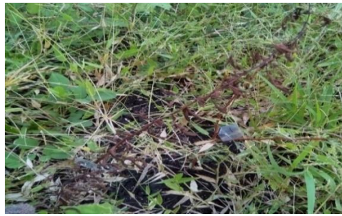
Gambar 2. A. nilotica (L.) Willd. yang telah mati pada pengamatan ke-4 ( A. nilotica (L.) Willd. who had died on the 4th observation)

Perlakuan 500 ppm dengan frekuensi pemberian ekstrak 3 hari sekali (K2L0) memberikan Dampak yang sama dengan perlakuan 750 ppm dengan frekuensi 6 hari sekali (K3L1) dimana daun mulai terlihat layu dan menguning pada pengamatan hari ke-30 (pengamatan ke-3) dan pada pengamatan hari ke-40 (pengamatan ke-4) sampel telah mati. Perlakuan K2L0 tidak menunjukkan Dampak mulai terjadinya kematian pada sampel A. nilotica (L.) Willd. yang sama dengan perlakuan K3L0 meskipun kedua perlakuan memiliki frekuensi pemberian ekstrak yang sama yaitu 3 hari sekali disebabkan oleh perbedaan kepekatan atau konsentrasi antar perlakuan. Semakin tinggi konsentrasi ekstrak daun pinus yang digunakan membuat Dampak yang terjadi pada sampel akan terlihat lebih cepat, sedangkan konsentrasi atau kepekatan yang semakin kecil akan memberikan Dampak atau pengaruh yang akan lebih lama.