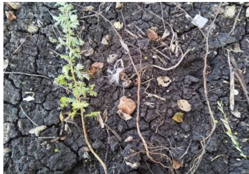
Gambar 4. Perbandingan sampel yang mengalami kematian dan tidak ( Comparison conditions of samples after treated )

ekstrak dan frekuensi penyiraman ekstrak daun pinus menunjukkan adanya pengaruh yang saling berkaitan. Kejadian tersebut dapat tersebut yaitu dimana apabila semakin tinggi konsentrasi ekstrak dan semakin sering frekuensi penyiraman ekstrak maka akan semakin besar dalam memberikan pengaruh terhadap sampel dan begitupula sebaliknya. Hal tersebut dapat terlihat pada hasil dari perlakuan dengan konsentrasi 750 ppm dengan frekuensi 3 hari sekali yang memberikan pengaruh yang paling besar jika dibandingkan dengan perlakuan yang lain.