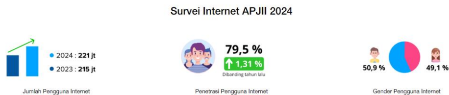
Gambar 1. 1 Data Survei APJII 2024

Kemajuan media sosial telah menciptakan dampak besar terhadap pola komunikasi dan interaksi manusia. Platform ini menyediakan akses yang mudah, biaya terjangkau, serta jangkauan luas, memungkinkan individu untuk berbagi karya dan gagasan kepada audiens global. Hal ini mendorong terciptanya kolaborasi dan kreativitas yang lebih besar, meskipun pemanfaatannya memerlukan kebijaksanaan agar dampak positif yang dihasilkan dapat dioptimalkan (Shinta & Putri, 2021).