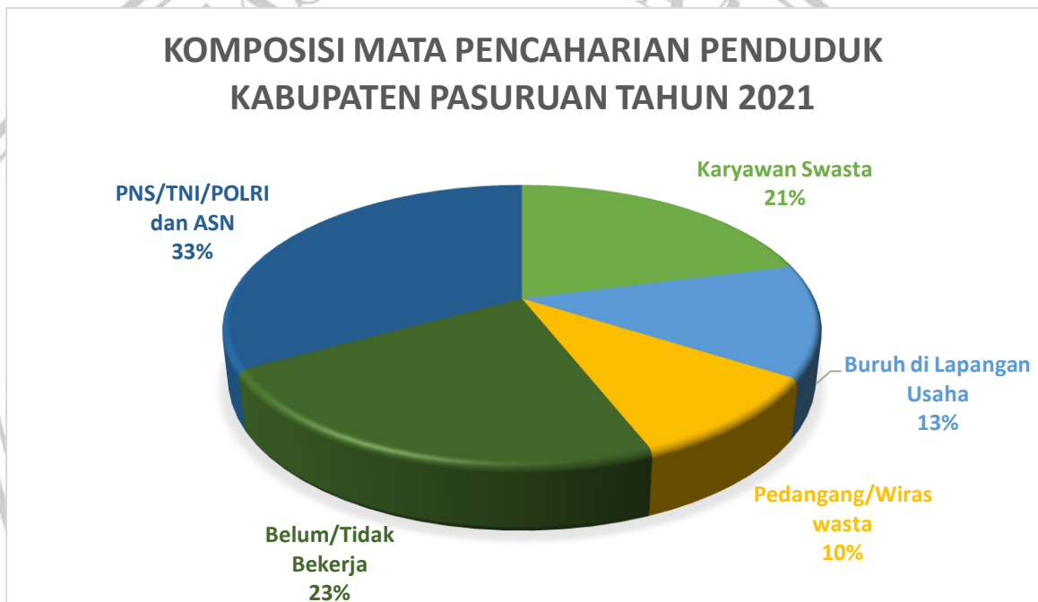
Gambar 3.1 : Komposisi Mata Pencaharian Penduduk Kabupaten Pasuruan Tahun 2021

Pada tahun 2021 yang berdasar kepada pendataan oleh Dinas Kependudukan dan Pencatatan Sipil memiliki struktur demografi pada jumlah penduduk sebesar 1.601.419 jiwa. Pada jumlah laki-laki 800.419 ribu jiwa dan perempuan 801.504 ribu jiwa sehingga mempunyai sex ratio sebesar 0.99 (maka dari setiap 100 penduduk perempuan, terdapat 99 penduduk laki-laki).