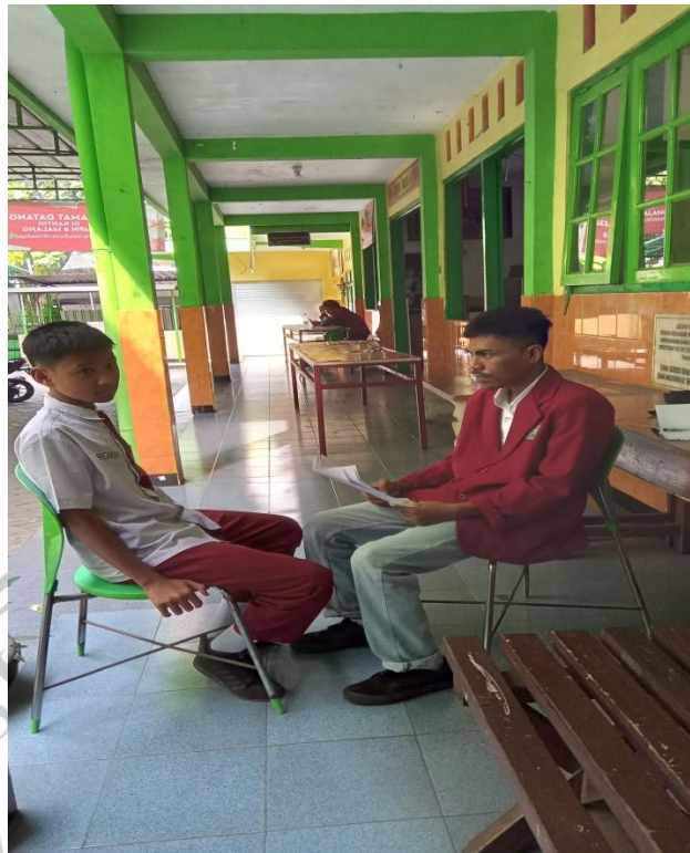
Gambar 4: Data Guru dan Karyawan