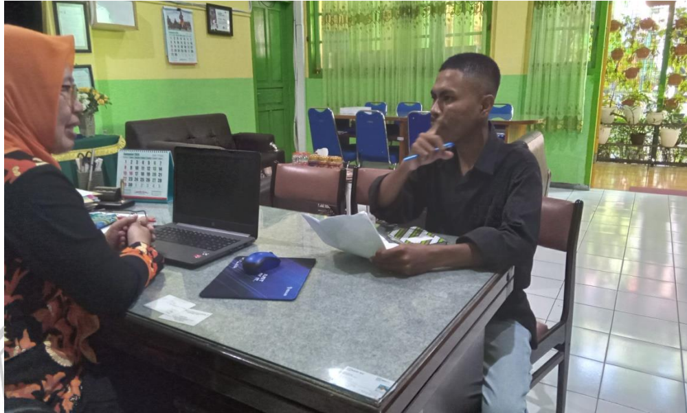
Gambar 2. Wawancara Guru PPKn