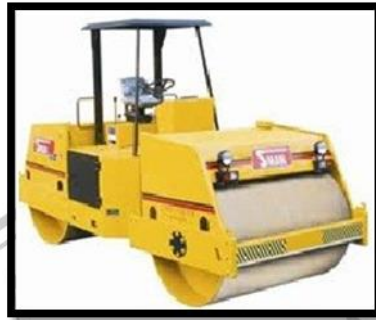
Gambar 2. 2 Vibrator Roller

Vibrator roller termasuk sebagai alat pemadatan. Biasanya digunakan untuk penggilasan akhir, artinya fungsi alat ini adalah untuk meratakan permukaan. Tandem roller tidak digunakan untuk permukaan keras dan tajam karena dapat merusak roda.