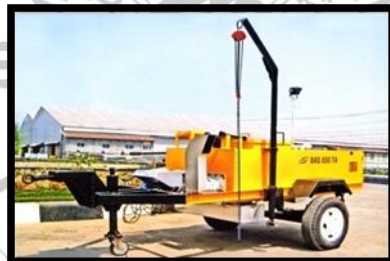
Gambar 2. 7 Asphalt Sprayer

Asphalt sprayer atau mesin asphalt sprayer berfungsi untuk menyemprotkan aspal cair pada pekerjaan coating, untuk memberikan lapis pengikat (tack coat).