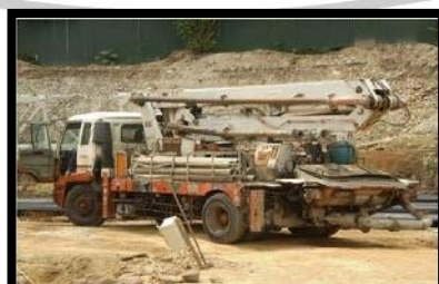
Gambar 2. 5 Concrete Vibrator

Alat ini terdiri atas beberapa bagian, yaitu alat utama berupa mesin pompa yang dilengkapi dengan tenaga penggerak berupa mesin diesel, sejumlah pipa berdiameter 15 cm serta nenerapa alat tambahan berupa klem penyambung pipa-pipa tersebut. Penggunaan mesin pompa kecil masih efisien untuk ketinggian 4-5 lantai.