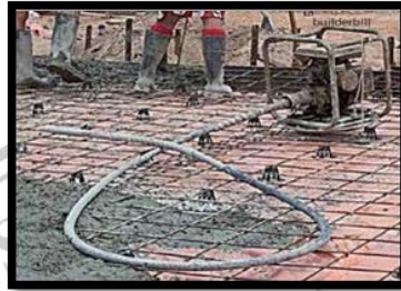
Gambar 2. 6 Concrete Pump

Concrete vibrator digunakan pada saat pekerjaan pengecoran beton. Fungsi dari concrete vibrator adalah meratakan dan memadatkan adukan beton dan dapat mencapai bagian-bagian yang sempit untuk mencegah adanya rongga-rongga kosong yang menyebabkan krops pada beton.