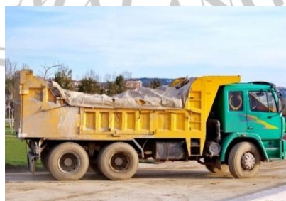
Gambar 2. 3 Dump Truck

Dump truck terdiri dari berbagai macam tipe, diantaranya dump truck roda empat dengan berat payload 2 ton – 3 ton, artikulatet dump truck untuk pekerjaan berat, dan dump truck dengan perlengkapan draw bar yang memiliki berat sampai 50 – 60 ton lebih.