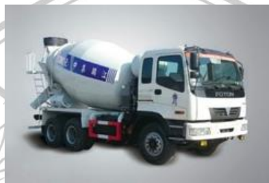
Gambar 2. 4 Truck Mixer

Alat yang dapat mencampur material-material diatas juga dikategorikan ke dalam alat pemroses material seperti concrete batch plant dan asphalt mixing plant. Kapasitas truck bervariasi tergantung pada kegunaan dan kebutuhan.