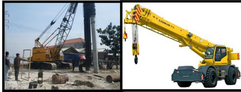
Gambar 2. 9 Crane Hammer Tiang Pancang dan Crane Erection