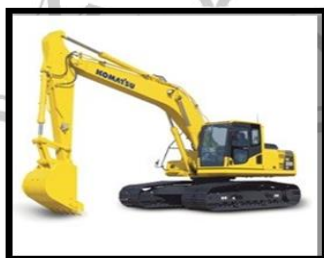
Gambar 2. 1 Backhoe