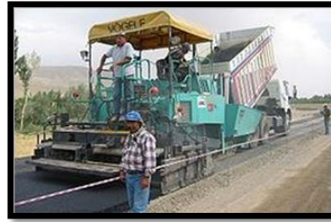
Gambar 2. 8 Asphalt Finisher