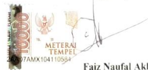
Faiz Naufal Akbar