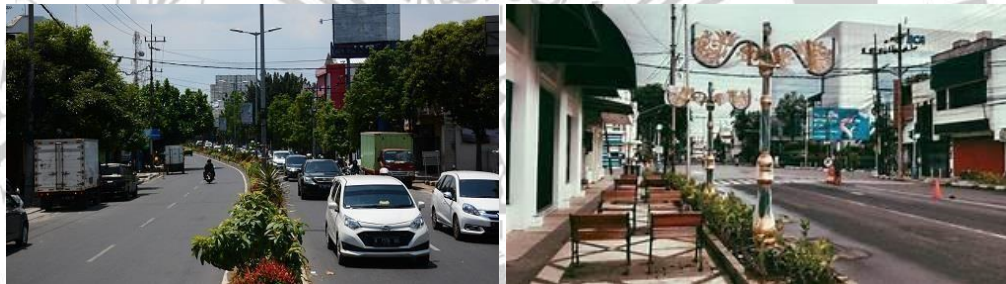
Gambar 1 2 sebelum dan sesudah

Perbandingan yang dilakukan pada gambar di atas merupakan bukti pembangunan sektor pariwisata yang berada pada jalan Kayu Tangan dan pembangunan Kampung Heritage dengan memperlihatkan kondisi sebelum dan sesudah adanya pembangunan dengan maksud memperkuat pariwisata. Dengan di bangun nya sektor pariwisata pada gambar di atas, maka kemungkinan kota Malang bisa memiliki brand kota yang di sebut dengan City Branding. Dengan ini, pemerintah kota Malang dapat berfokus pada penerapan City Branding tersebut dengan memperkenalkan kepada nasional maupun internasional guna menarik wisatawan yang datang.