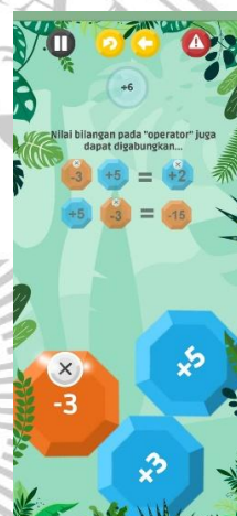
Gambar 6 Tutorial