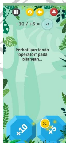
Gambar 5 Tutorial