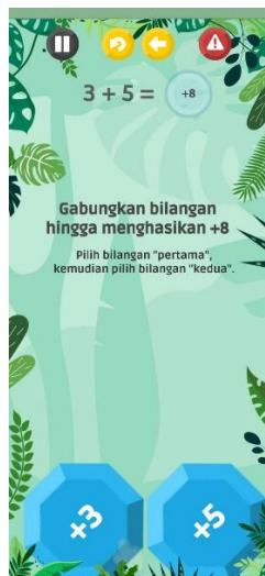
Gambar 3 Tutorial