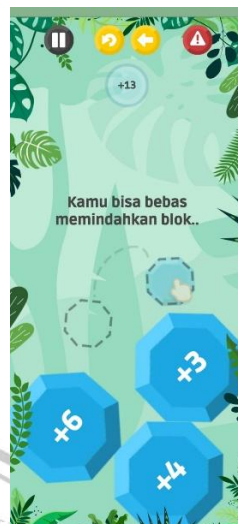
Gambar 4 Tutorial