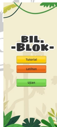
Gambar 2 Menu dalam Game