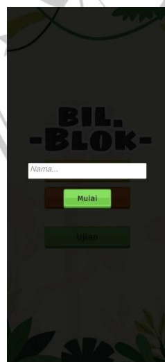
Gambar 1 Kolom untuk memasukan nama pemain