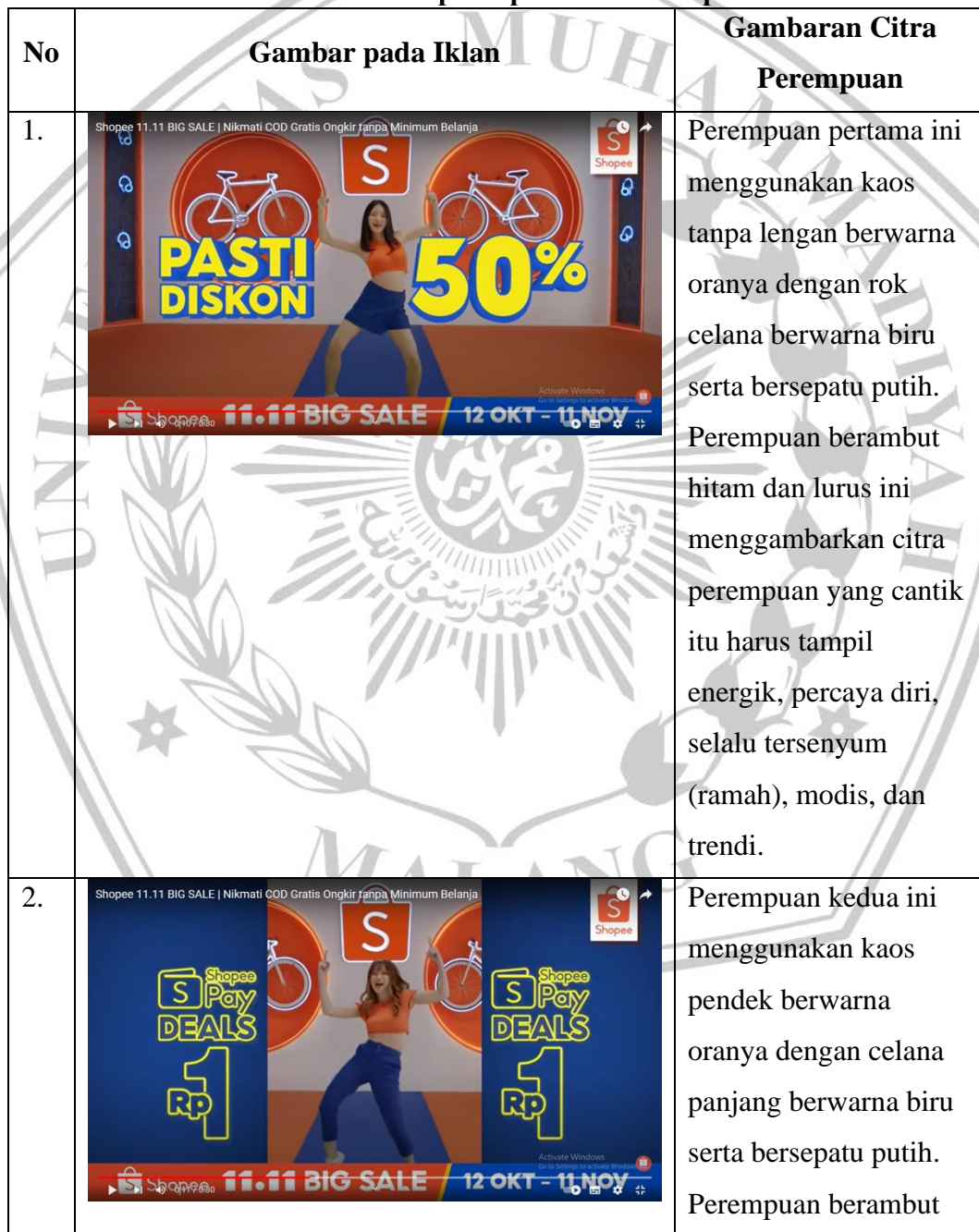
Tabel 4.1. Gambaran Citra Perempuan pada Iklan Shopee 11.11