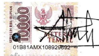
Mega Milenia A.R