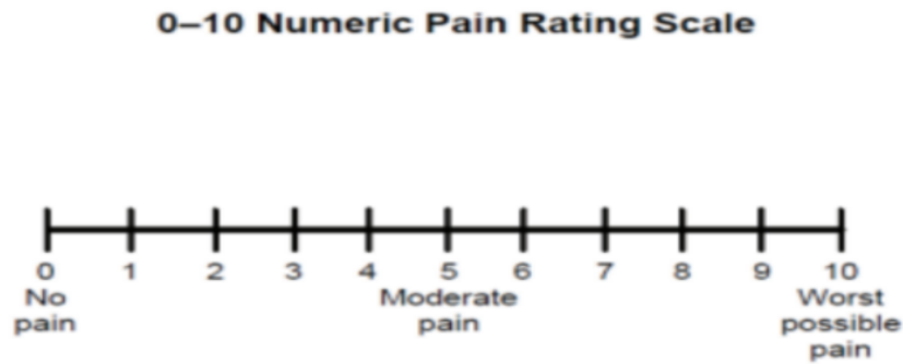
Gambar 2. 1 Numerical Rating Scale (NRS)

Penderita diminta untuk menyatakan rasa sakitnya dalam skala angka 0-10. Angka 1-3 nyeri ringan, angka 4-6 nyeri sedang, angka 7-10 nyeri berat.