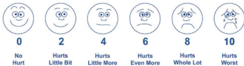
Wong-Baker FACES pain rating scale

dipilih 0, 2, 4, 6, 8, atau 10, mengitung dari kiri ke kanan, jadi “0” tidak sakit” dan “10” sama dengan “sangat sakit”. Penderita memiliki ekspresi wajah yang paling mewakili rasa sakitnya. Jangan ginakan kata-kata seperti “senang” dan “sedih”. Skala ini dimaksudkan untuk mengukur bagaimana perasaan anak-anak di dalam, bbukan bagaimana rupa wajah mereka.