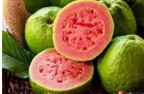
Gambar 2. 1 Buah Jambu Biji ( Psidium guajava )