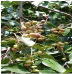
Gambar 2. 3 Jamblang ( Syzygium cumini )