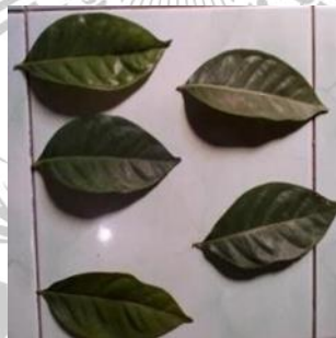
Gambar 2. 2 Daun Salam ( Syzygium polyanthum )