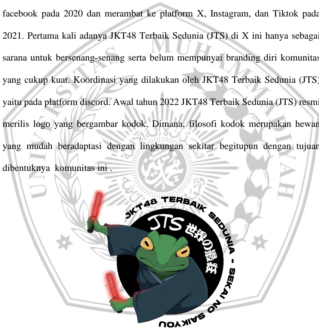
Gambar 1. 2

Fandom merupakan komunitas yang terbentuk di sekitar minat yang sama terhadap suatu hal tertentu, seperti buku, film, musik, maupun tokoh terkenal. JKT48 Terbaik Sedunia (JTS) salah satu fandom dari idol grup JKT48 yang masih aktif sampai sekarang. JKT48 Terbaik Sedunia (JTS) dibentuk pertama kali di facebook pada 2020 dan merambat ke platform X, Instagram, dan Tiktok pada 2021. Pertama kali adanya JKT48 Terbaik Sedunia (JTS) di X ini hanya sebagai sarana untuk bersenang-senang serta belum mempunyai branding diri komunitas yang cukup kuat. Koordinasi yang dilakukan oleh JKT48 Terbaik Sedunia (JTS) yaitu pada platform discord. Awal tahun 2022 JKT48 Terbaik Sedunia (JTS) resmi merilis logo yang bergambar kodok. Dimana, filosofi kodok merupakan hewan yang mudah beradaptasi dengan lingkungan sekitar begitupun dengan tujuan dibentuknya komunitas ini .