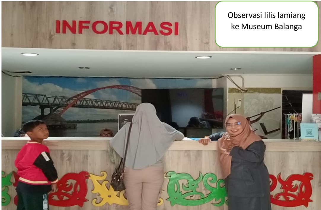
Observasi lilis lamiang ke Museum Balanga