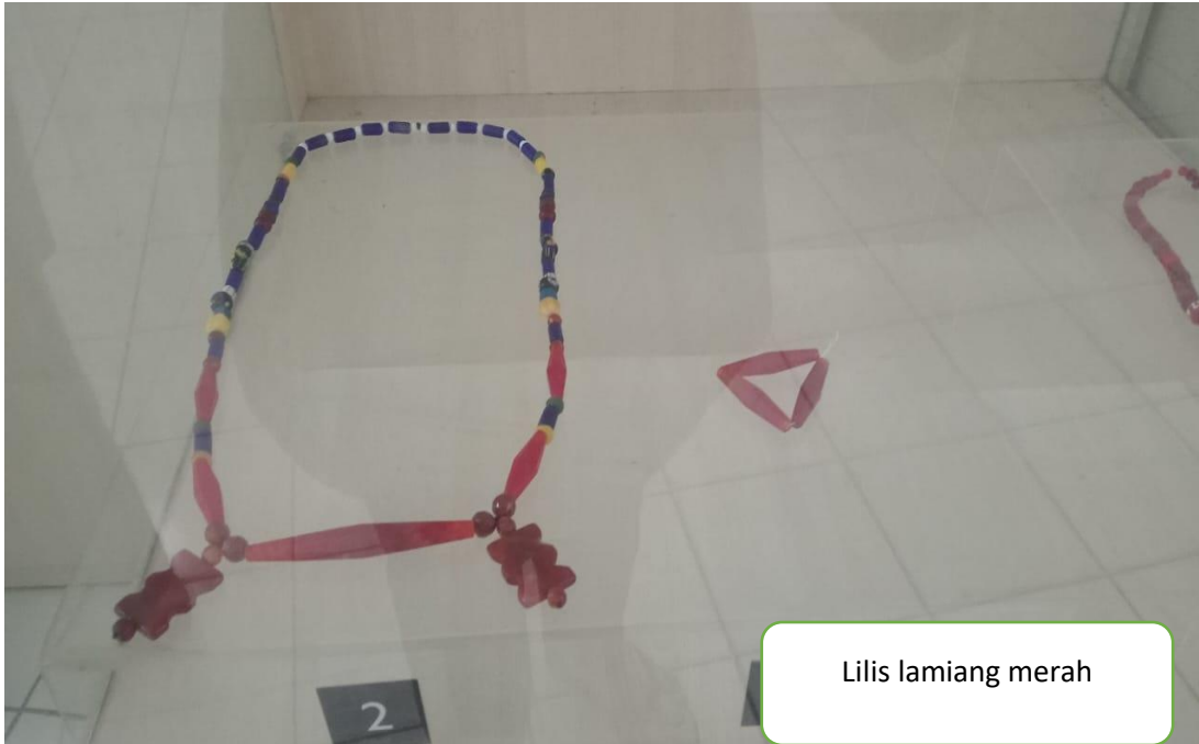
Lilis lamiang merah