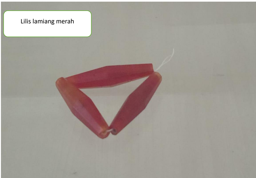
Lilis lamiang merah