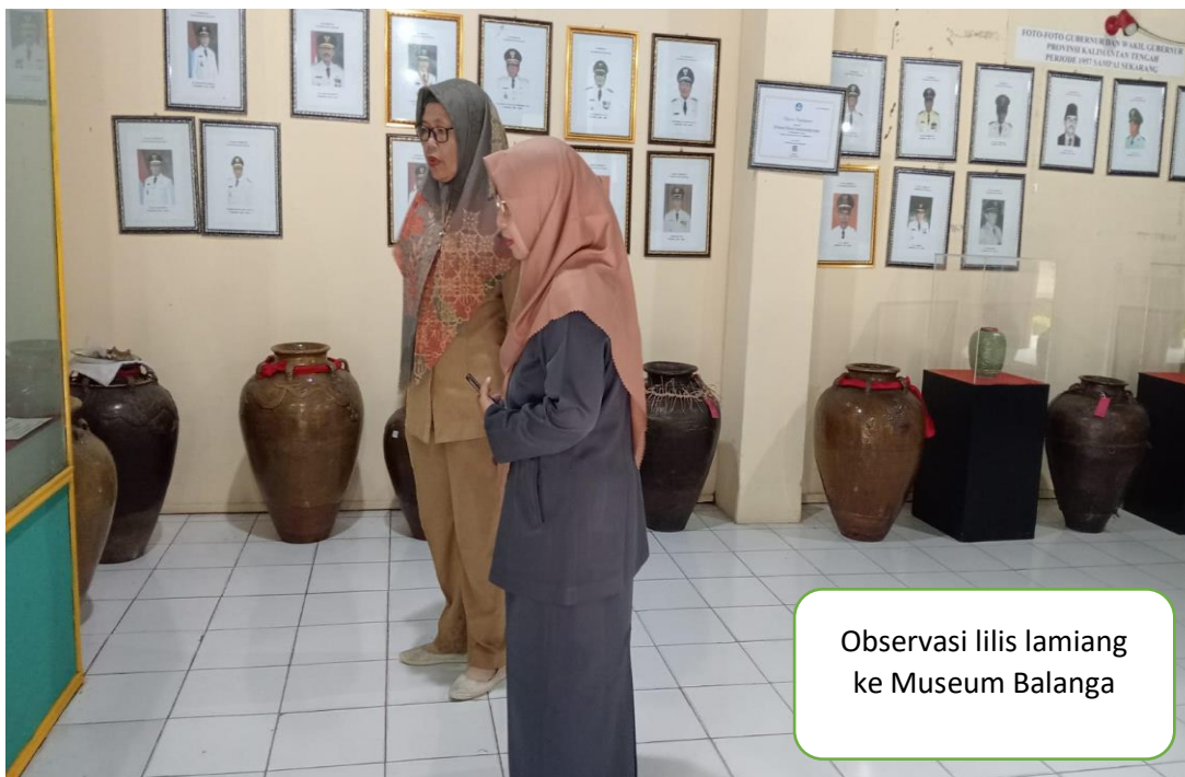
Observasi lilis lamiang ke Museum Balanga