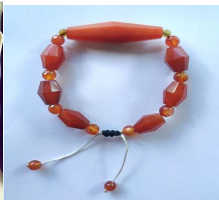
Gambar 2. Lamiang Oren

Tjilik Riwut (dalam Riwut, 2012) pada kepercayaan suku Dayak, “ Lilis lamiang berasal dari buah pohon batang garing atau pohon kehidupan, sehingga Lilis lamiang mendapatkan posisi yang sakral dalam masyarakat adat Dayak”. Oleh karena itu, lilis lamiang dijadikan sebagai benda yang sakral dalam proses ritual adat masyarakat Dayak.