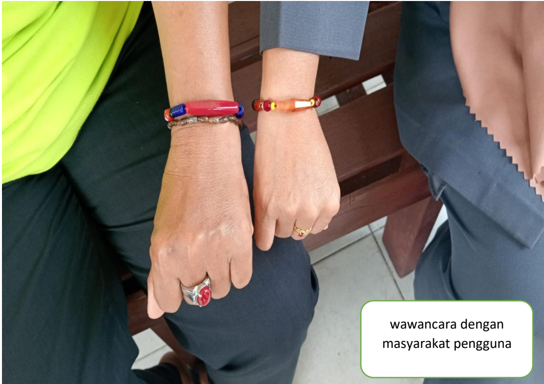
wawancara dengan masyarakat pengguna