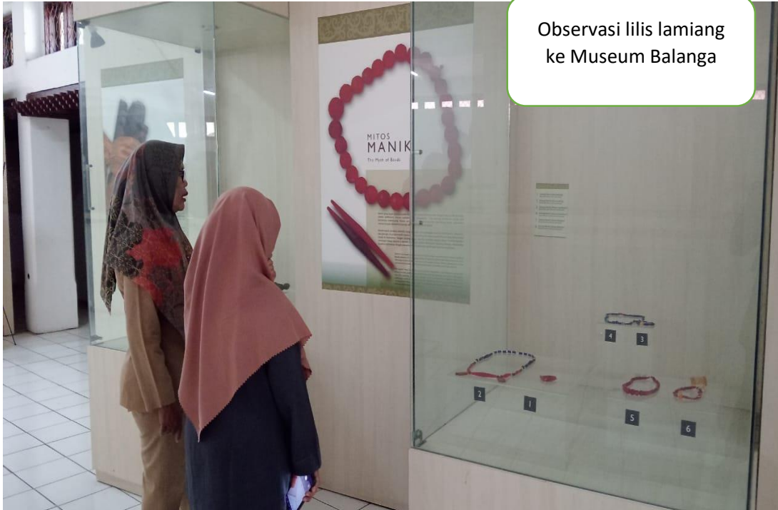
Observasi lilis lamiang ke Museum Balanga