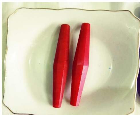
Gambar 1. Lamiang merah

dengan keyakinan Hindu Kaharingan atau terhadap Tuhannya tetapi masih banyak masyarakat yang di masa kini tidak mengetahui bahkan tidak paham hal tersebut”.