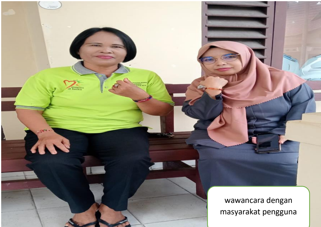
wawancara dengan masyarakat pengguna