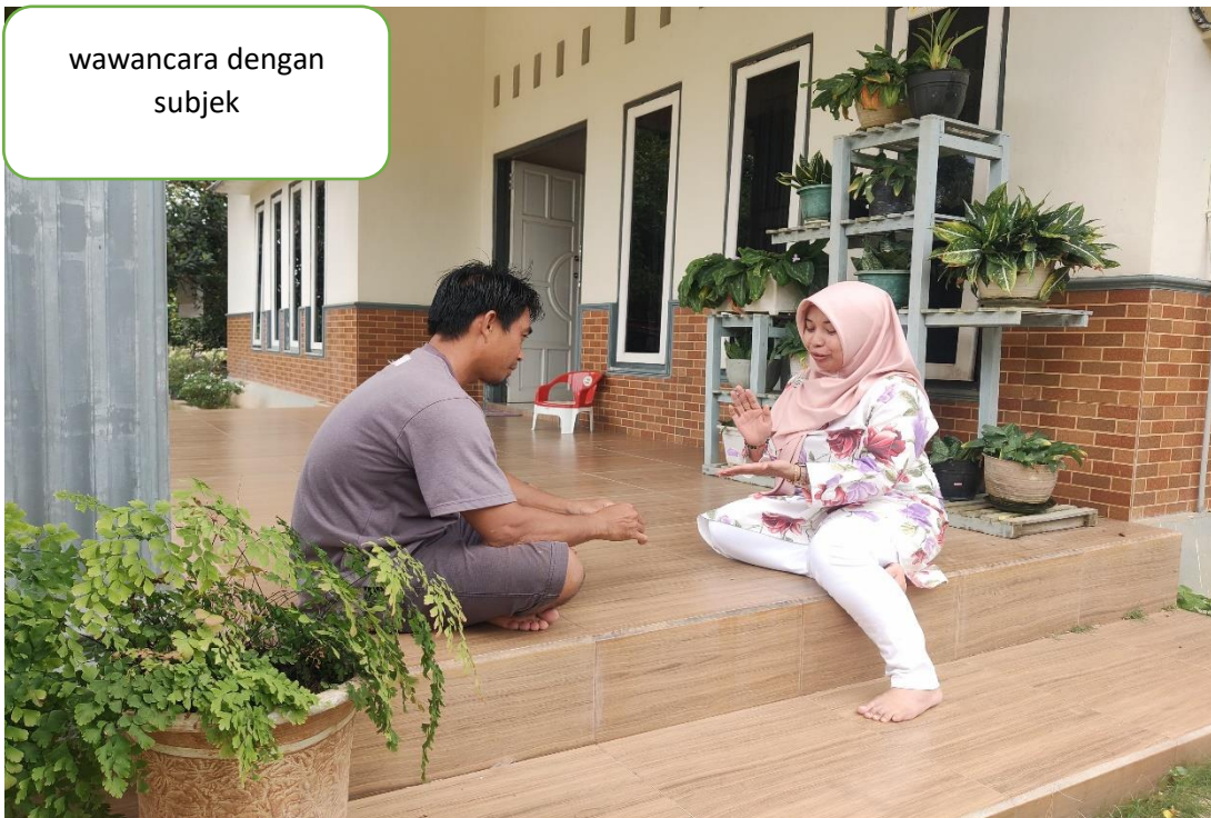
wawancara dengan subjek