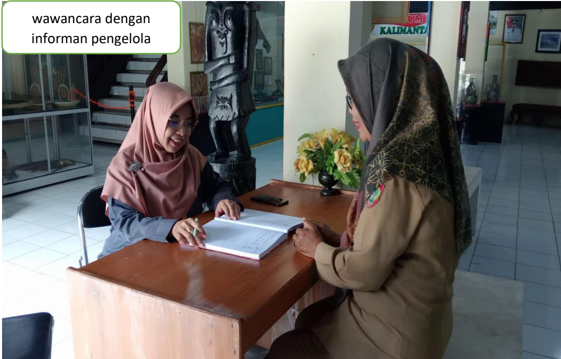
wawancara dengan informan pengelola