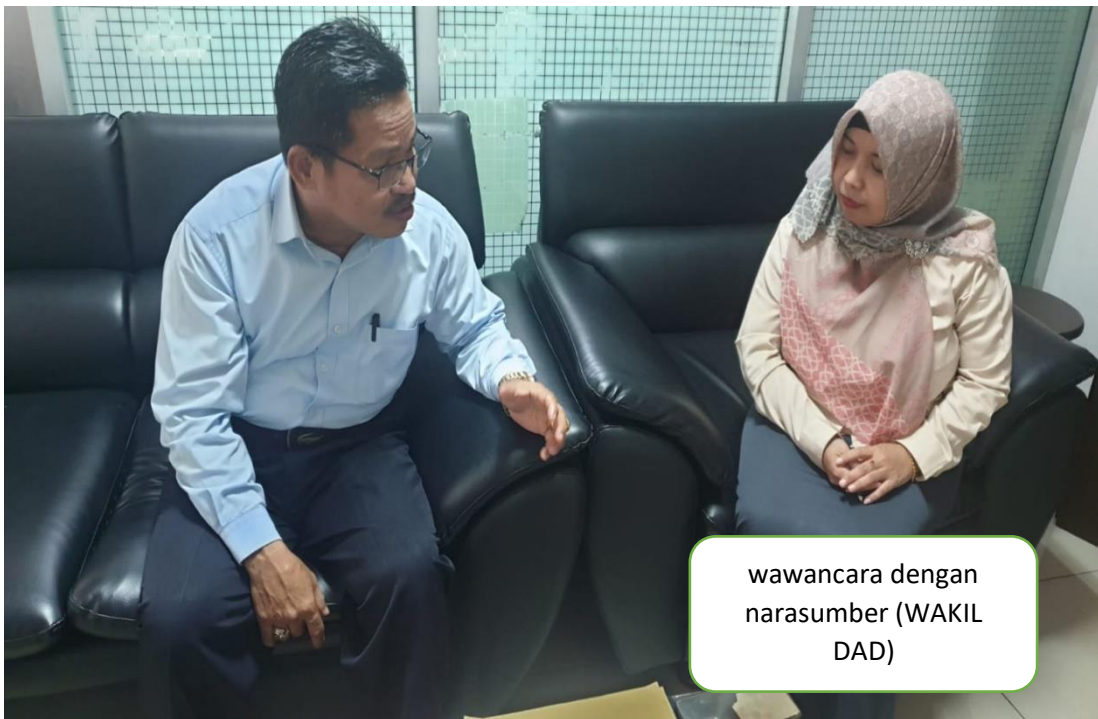
wawancara dengan narasumber (WAKIL DAD)