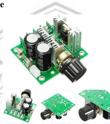
Gambar 2. 8 PWM Module

PWM Module atau speed control merupakan salah satu komponen elektronika yang digunakan untuk mengontrol perputaran pada motor DC. Karena perputaran motor DC sangat bervariasi, maka dibutuhkan module speed control untuk mengatur kecepatan putaran sesuai dengan kebutuhan. Dalam alat ini, A348 pwm module digunakan untuk mengatur kecepatan motor pada konveyor, rotary capping dan juga pada motor untuk pemberian tutup botol agar bisa bergerak secara sinkron.