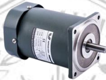
Gambar 2. 2 Motor DC

Motor arus searah (motor DC) merupakan motor yang digunakan untuk mengubah energi listrik menjadi energi mekanik atau gerak. Prinsip kerja dari arus searah ialah dengan membalik fasa tegangan dari gelombang yang mempunyai nilai positif dengan menggunakan komutator, maka arus yang berbalik arah akan berputar dalam medan magnet [4]. Motor DC ini berfungsi sebagai penggerak pada perangkat elektronik dan listrik seperti konveyor, bor listrik dan sebagainya. Pada umumnya motor DC lebih sering digunakan daripada motor AC karena jenis motor ini mudah untuk dikendalikan. Dalam prinsip kerjanya motor ini menghasilkan putaran per menit atau disebut dengan RPM ( Revolution per Minute ) yang dapat berputar berlawanan dengan jarum jam ataupun searah dengan jarum jam.