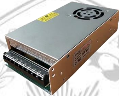
Gambar 2. 6 Power Supply 24V/10A

Power supply atau yang biasa disebut catu daya merupakan sebuah komponen yang menyediakan daya listrik untuk perangkat listrik maupun elektronik. Pada dasarnya fungsi dari power supply sama dengan adaptor, hanya saja power supply umumnya lebih kompleks dan dapat digunakan untuk memberikan daya pada berbagai perangkat di dalam unit sistem. Meskipun terlihat sederhana namun komponen ini sangat penting sebagai pemberi daya pada alat atau mesin.