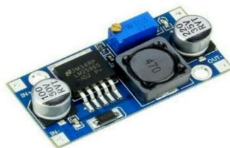
Gambar 2. 5 LM2596 DC-DC Converter