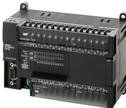
Gambar 2. 1 PLC OMRON CP1E

Programmable Logic Controller atau PLC merupakan suatu alat yang dapat digunakan untuk menggantikan relay yang biasa ditemui pada sistem kontrol konvensional (L. A. Bryan dan E. A. Bryan dalam Airlangga dkk., 2017). PLC bekerja dengan cara menerima input melalui sensor atau push button kemudian melakukan proses sesuai dengan program yang telah dibuat. Dimana pengguna dapat membuat program melalui CX-Programmer menggunakan ladder diagram sebagai bahasa pemrogramannya, setelah itu program akan dijalankan oleh PLC.