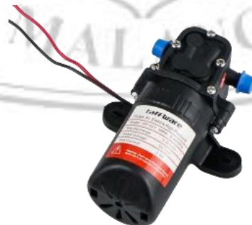
Gambar 2. 7 Pompa Air DP-521

Pompa air merupakan alat yang mengkonversikan energi mekanik menjadi kinetik, dimana alat ini digunakan untuk memindahkan cairan atau fluida dari suatu tempat ke tempat yang lain. Dalam alat ini pompa akan bekerja dengan digerakkan