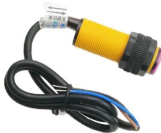
Gambar 2. 3 Sensor photoelectric E3F-DS30C4 NPN NO