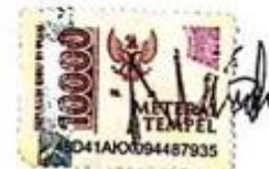
Nanda Fiqki Wulandari