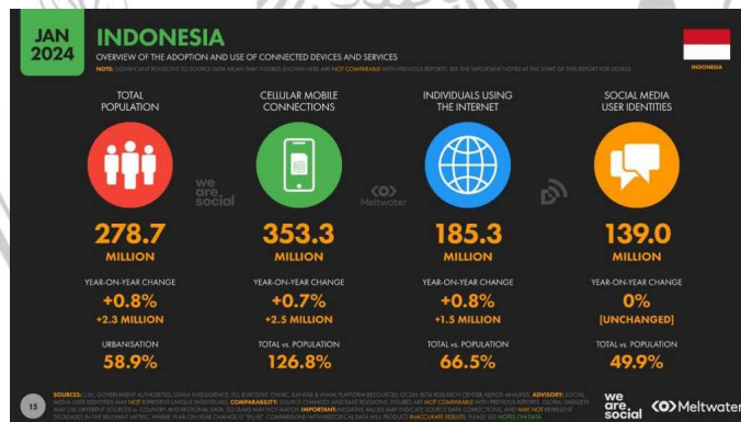
Gambar 1. 1 Data Pengguna Internet di Indonesia.

Jutaan pengguna internet di seluruh dunia dapat mengakses layanan telekomunikasi dan sumber informasi melalui internet. Dengan kemajuan teknologi internet, software seperti media sosial sekarang dapat digunakan untuk mencari informasi dengan cepat. Data yang dikumpulkan oleh Hootsuite dan We Are Social menunjukkan bahwa 212,9 juta orang, atau 77% dari 278,7 juta orang Indonesia, adalah pengguna internet aktif (Riyanto, 2024).