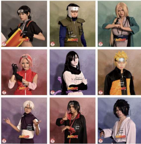
Gambar 1. 4 Costume Play atau Cosplay

Para penggemar manga atau anime yang menirukan karakter karakter dari anine biasanya melakukan cosplay. Cosplay merupakan kegiatan menirukan karakter tertentu dari anime, game, manga, film populer, dan ikon atau grup idola dengan memakai kostum, berdandan, atau memakai aksesoris (Pramana & Mujab Masykur, n.d.). Cosplay pertama kali muncul di Indonesia sekitar tahun 2000-an, yang berawal dari suatu acara yang diadakan di Universitas Indonesia. Menurut tulisan Nauval Prabowo (Mardiharto, n.d.), cosplay pertama kali dilakukan di Indonesia pada acara Animoster sound pada April 2004, tetapi tidak menggunakan istilah "cosplay".