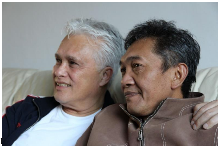
Harry, tampak sekali mereka tidak terhalangi oleh status sosial, melambangkan suatu interaksi budaya dua negara.