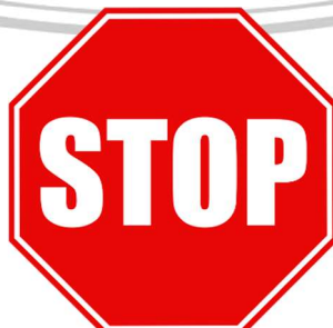
Gambar 2. 4 Rambu Berhenti

Stop sign atau rambu berhenti digunakan apabila pengemudi yang berasal dari ruas jalan pada simpang diwajibkan berhenti sebelum masuk ke area simpang, biasanya rambu berhenti tersebut digunakan pada pertemuan jalan minor dan jalan utama. Rambu berhenti dapat dilihat pada Gambar 2.4.