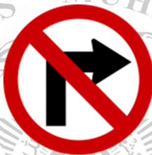
Gambar 2. 3 Rambu Larangan Belok Kanan

Rambu larangan belok kanan digunakan untuk melarang pengguna jalan baik kendaraan bermotor maupun pengguna jalan tidak bermotor untuk tidak berbelok ke arah kanan. Tujuannya untuk menghindari antrian kendaraan pada ruas jalan tersebut. Rambu larangan belok kanan dapat dilihat pada Gambar 2.3.