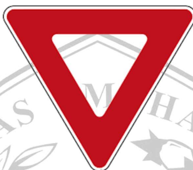
Gambar 2. 5 Rambu Yield Sumber : Rekayasa Lalu Lintas: 95