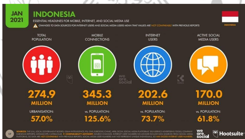
Gambar 1. 1 Data pengguna internet dan media sosial di Indonesia

Menurut laporan terbaru dari We Are Social dan Hootsuite terdapat data yang menunjukkan bahwa pada Januari 2021 total orang yang menggunakan internet di Indonesia mencapai 202,6 juta. Jumlah tersebut meningkat sebesar 27 juta atau sekitar 16% dibandingkan tahun sebelumnya. Selain itu, rasio pengguna internet di Indonesia mencapai 73,7% pada bulan yang sama. Hootsuite dan We Are Social juga mencatat bahwa jumlah penduduk Indonesia mencapai 274,9 juta jiwa. Dengan adanya 202,6 juta jiwa menggunakan internet, berarti sekitar 73,7% penduduk Indonesia memiliki akses dan kemampuan untuk menjelajahi internet.