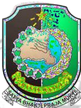
Gambar 3 1: Logo Kabupaten Banyuwangi

Kabupaten Banyuwangi berada di Jawa Timur. Wilayah ini termasuk dataran tinggi seperti pegunungan merupakan daerah budidaya dan produksi datarannya menyediakan macam-macam sumber hasil darat dan lautan, kawasan pantai yang membentang mulai ujung utara hingga ke selatan merupakan kawasan produksi biota laut. Luas wilayah Banyuwangi kurang lebih 5.782,50 km 2 dengan total populasi penduduk 1.769.234 jiwa penyebaran penduduk 310/km 2 . Luas hutan ini mencapai 183.396,34 ha atau sekitar 31,72%, dengan sawah sekitar 66.152 ha atau 11,44%, perkebunan sekitar 82.143,63 ha atau 14,21%, dan gugusan hutan sekitar 82.143,63 ha atau 14,21%. Luas sisa hutan adalah 127.454.22 ha atau 22,04%.