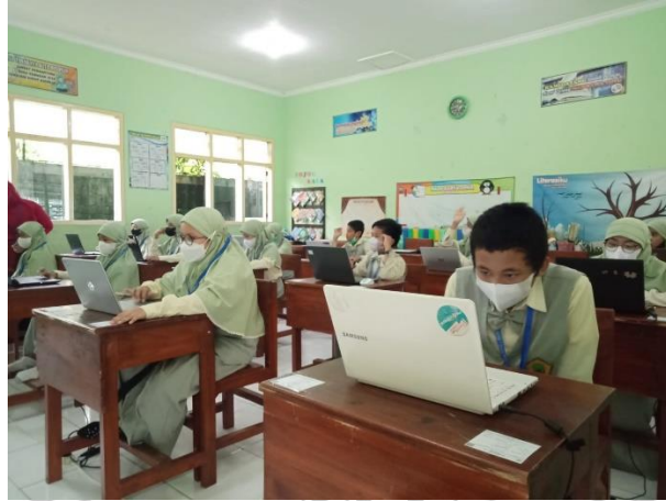
Dokumentasi pelaksanaan AKM