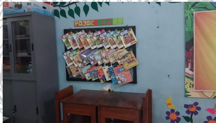
Dokumentasi Pojok Baca Sekolah