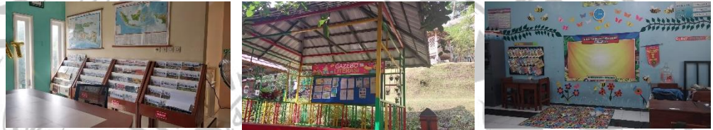
Gambar 4.1 Contoh Sarana dan Prasarana SD Muhammadiyah 4 Kota Malang

“Guru-guru di sekolah kami sangat hebat sekali, guru kelas IV sudah mampu memberikan pembelajaran yang mengacu pada persiapan AKM sehingga saat anak-anak tersebut naik di kelas V, mereka tidak lagi kaget untuk mengerjakan soal-soal berbasis AKM. Sebagian dari mereka lebih rajin belajar dan membaca buku-buku yang berwawasan global. Tentu hal ini menjadi ukuran keberhasilan kami dalam mengidentifikasi kemampuan literasi dan numerasi peserta didik” (Y/13.06.2023).