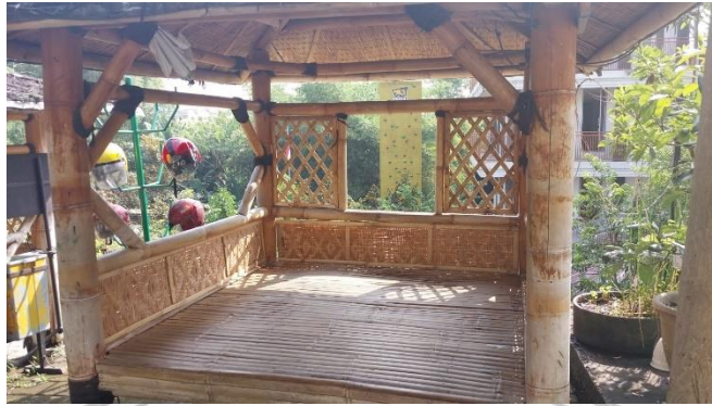
Dokumentasi Gazebo Literasi