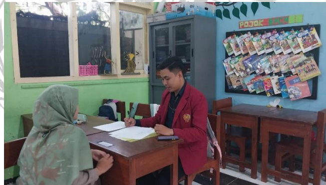
Dokumentasi Wawancara Informan