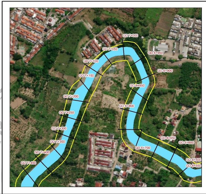
Gambar 3.1 Denah Lokasi Studi Perencanaan Krib