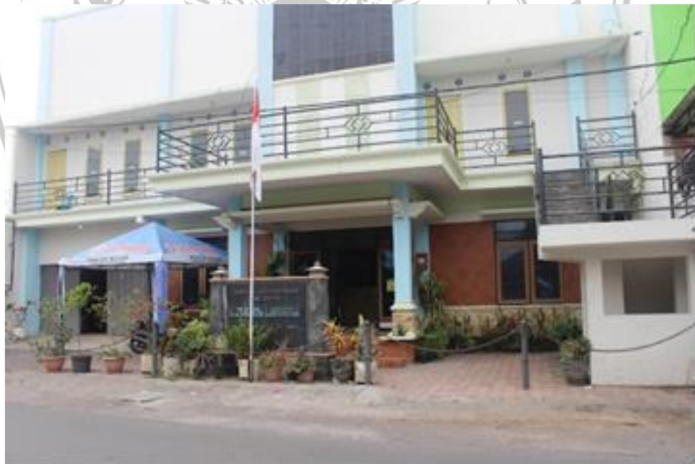
Gambar 3.2.1. Kantor Pemerintah Desa Landungsari