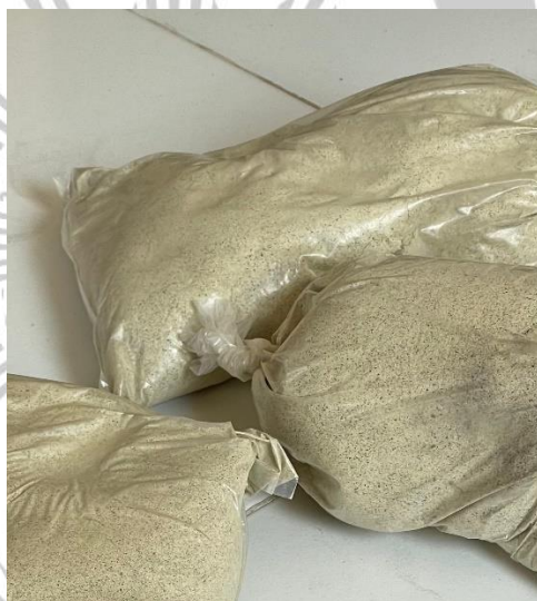
Gambar 2.2 Tepung Koro Komak ( Dolichos lablab L. )

kaya dengan protein serta memiliki indeks glikemik yang rendah. Analisis indeks glikemik dengan in vitro menunjukkan bahwa tepung koro mempunyai nilai Indeks glikemik yang rendah yaitu sebesar 43,50. Rendahnya nilai indeks tersebut menandakan bahwa tepung koro komak bagus digunakan sebagai food ingredient untuk orang yang diet serta terkena diabetes melitus (Nafi et al., 2013). Selain itu tepung koro komak baik untuk mengontrol kadar gula darah serta membantu meningkatkan kesehatan jantung dan mengurangi risiko penyakit kronis. Tepung koro komak juga mengandung serat yang tinggi ditandai dengan nilai perkiraan sebesar 10,68% db (Tamtarini & Yuwanti, 2005). Serat yang tinggi ini dapat membantu untuk meningkatkan kesehatan pada pencernaan, kemudian dapat membantu mengurangi keinginan untuk makan serta meningkatkan rasa kenyang (Sinulingga, 2020).