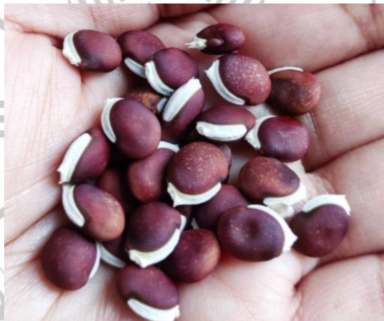
Gambar 2.1 Koro Komak ( Dolichos lablab L.)

Kingdom : Plantae Ordo : Fabales Famili : Fabaceae Genus : Dolichos Spesies : Dolichos lablab L. (Andrew et al., 2006)