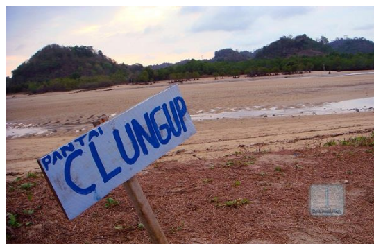
Gambar 2. Pantai Clugup