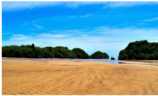
Gambar 3. Pantai Gatra