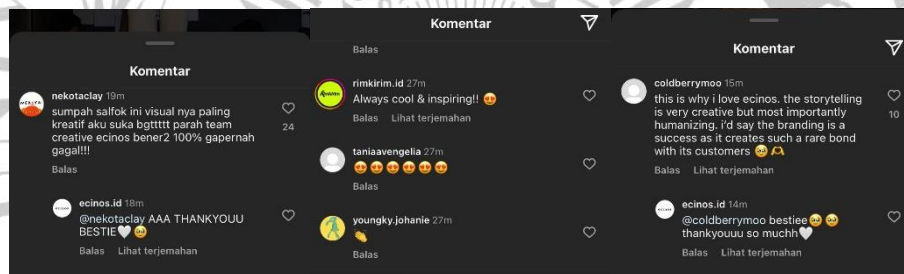
Gambar 1. 3 Komentar Followers Instagram @ecinos.id

Selain memiliki akun Instagram ecinos juga memiliki akun media sosial lain dan media belanja online yang sering digunakan untuk promosi brand mereka. Namun Ecinos ini lebih aktif dalam Instagram, mereka lebih sering update insta-story dan juga postingan-postingan yang selain promosi brand mereka tapi juga tips and trick berpakaian serta mix and match yang sering disukai para pengguna khususnya mahasiswa, tak hanya itu Ecinos juga sering menyelipkan update-an tentang kehidupan si admin yang mungkin relate dengan para pengguna Instagram jaman sekarang dan juga lebih memotivasi followers atau pembaca. Instagram @Ecinos.id memiliki 497rb followers, memiliki 904postingan yang di dalamnya juga menampilkan inspirasi mix and match dari brand ecinos sendiri juga inspirasi perjalanan brand ini dibuat, dari sinilah para mahasiswa ataupun followers @Ecinos.id terinspirasi mengikuti apa yang mereka butuhkan dalam memakai media sosial (Monanda & Nurjanah, 2017).