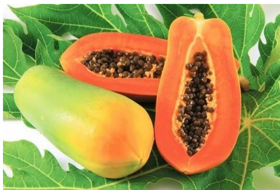
Gambar 2.4 Carica papaya L. (Peristiowati et al. ,2018)

Taksonomi tanaman pepaya menurut (Peristiowati et al. ,2018) adalah sebagai berikut: