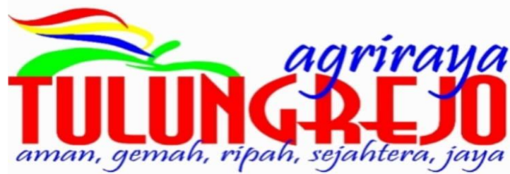
Gambar 3. 2 Logo Desa Tulungrejo