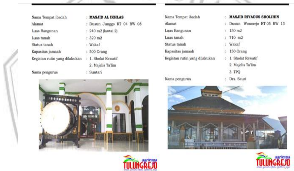
Gambar 3. 4 Data Masjid Desa Tulungrejo