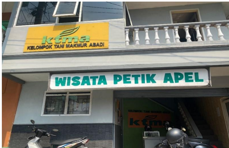
Gambar 3. 5 Kantor Wisata Petik Apel Kelompok Tani Makmur Abadi

Dusun Gondang, Dusun Kekep, Dusun Gerdu, Dusun Wonorejo, dan Dusun Junggo.