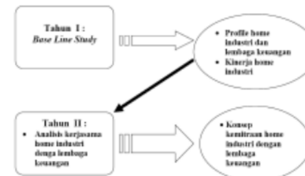
Gambar 1. Jenis dan teknik pengambilan data

Metode analisis data yang digunakan dalam penelitian ini adalah mixing metode (analisa kuantitatif dan kualitatif). Pada data yang bersifat kuantitatif juga dilengkapi dengan analisis deskriptif kualitatif.