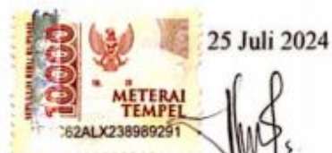
Safira Zahra Ramadani

Demikian pernyataan ini saya buat dengan sebenarnya untuk dipergunakan sebagaimana mestinya.