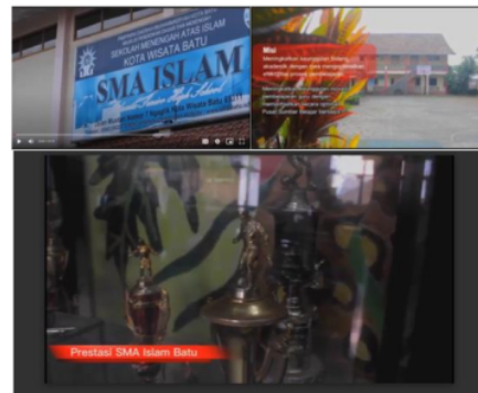
Gambar 1. Video Profil sekolah

Evaluasi dari kegiatan pengabdian masyarakat dilakukan secara bertahap, yaitu saat pelaksanaan berlangsung dan setelah kegiatan. Evaluasi dilakukan secara berkala untuk melihat hasil dari kegiatan yang sudah dilakukan. Keberlanjutan program dapat dilihat dari langkah tindak lanjut. Hasil dari media sosial sekolah dapat dilihat melalui IG atau website sekolah