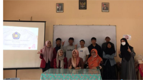
Gambar 1. Kegiatan Workshop CapCut

untuk melakukan promosi keluar, baik itu untuk siswa maupun pihak lain. Pada video profil terdapat visi misi sekolah, fasilitas sekolah dan prestasi.