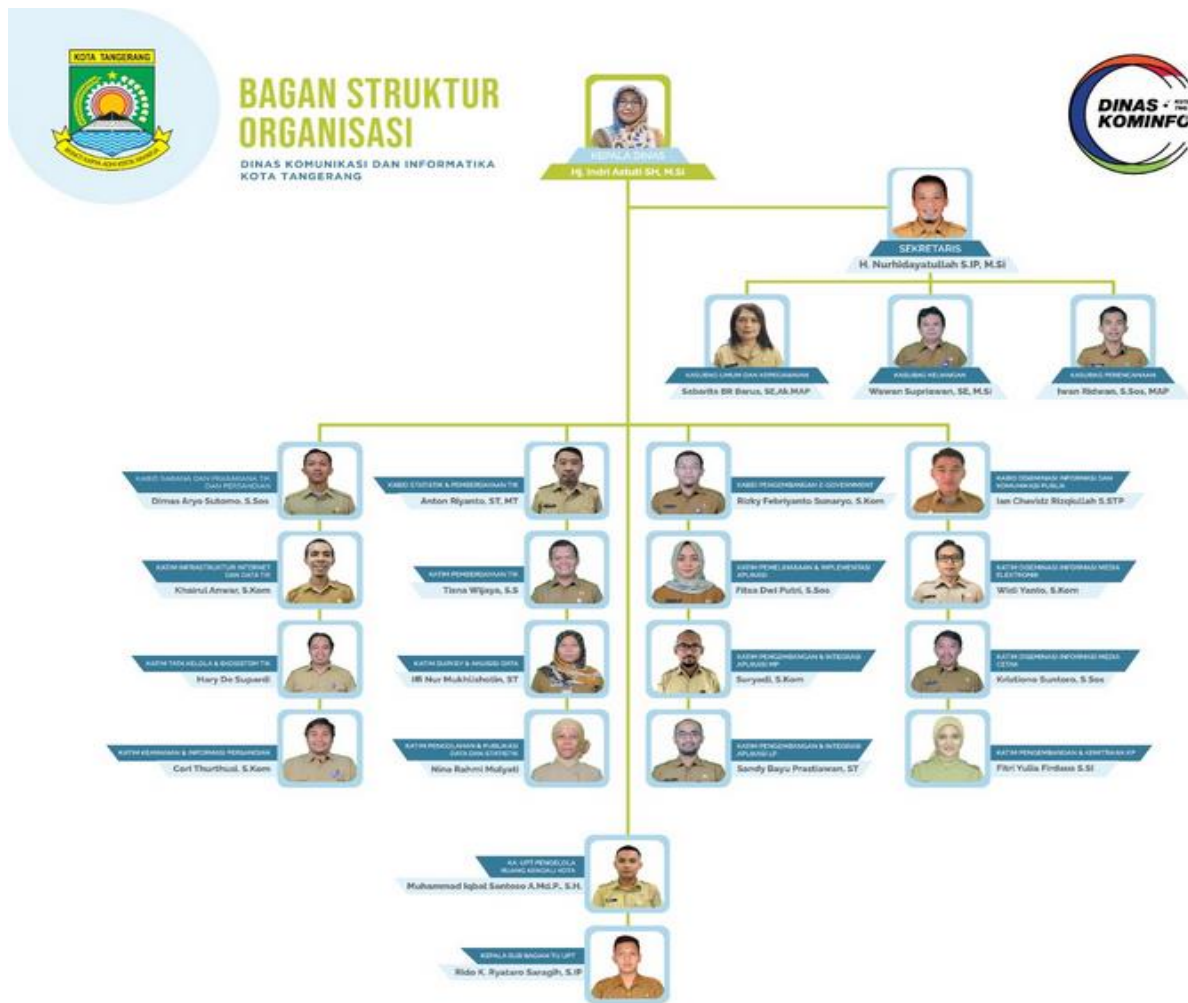
Gambar 2. Struktur Organisasi Kantor Diskominfo Kota Tangerang