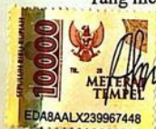
Aisyah Nur Syamsia