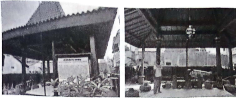
Gambar 1 Pendopo Situs Watu Gong (Kiri). Benda-Benda di Dalam Situs (Kanan).