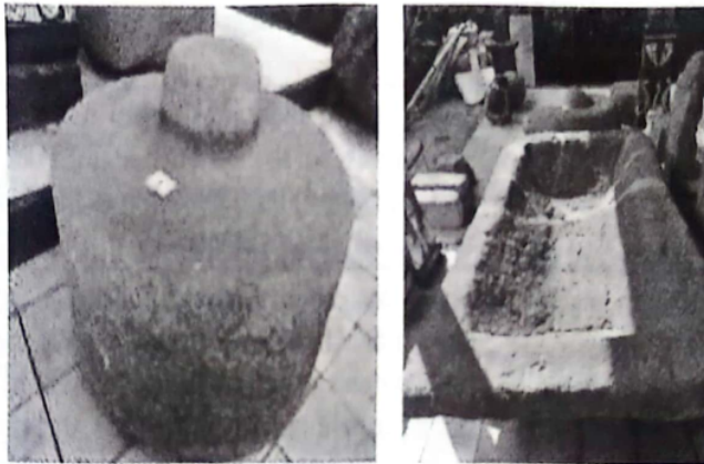
Gambar 2 Batu Berbentuk Gong (Kiri). Jambangan Tempat Air Suci (Kanan).