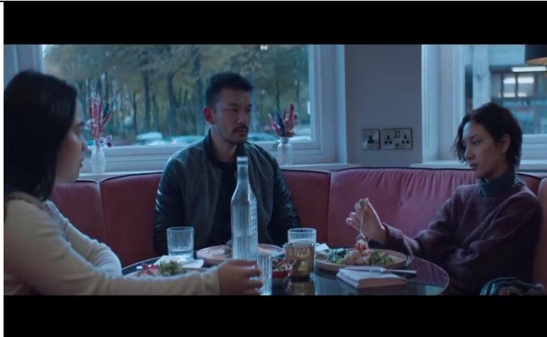
Gambar 2. 5

Angkasa dan Awan meminta penjelasan karena selama dua bulan Aurora tidak memberi kabar kepada keluarganya.