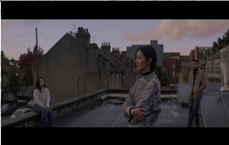
Gambar 2. 8

Pertemuan antara Aurora dengan kedua saudaranya setelah terjadi konflik di antara mereka.