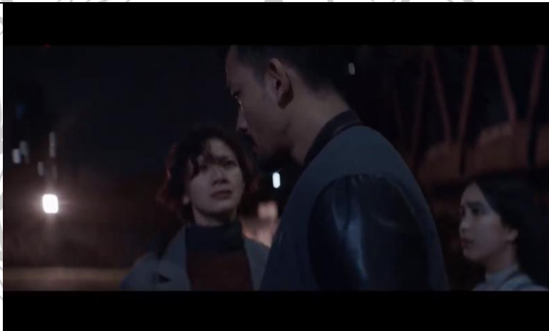
Gambar 2. 6

Ungkapan hati Aurora kepada Angkasa dan Awan terhadap sikap mereka yang selalu ikut campur dan mengintimidasinya.