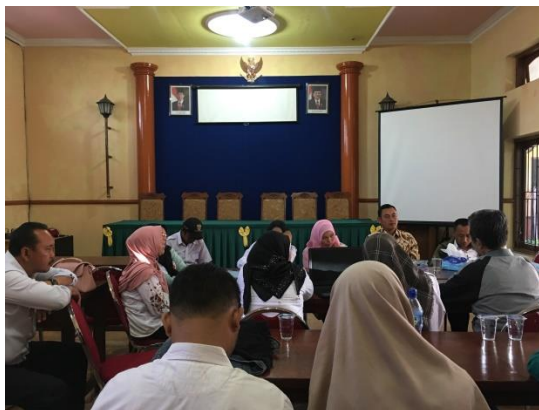
Dokumentasi saat melakukan Monitoring dan Evaluasi oleh Pemerintah Kota Batu, Pemerintah Kecamatan Batu, Pemerintah Desa Sumberejo dan Pendamping Desa