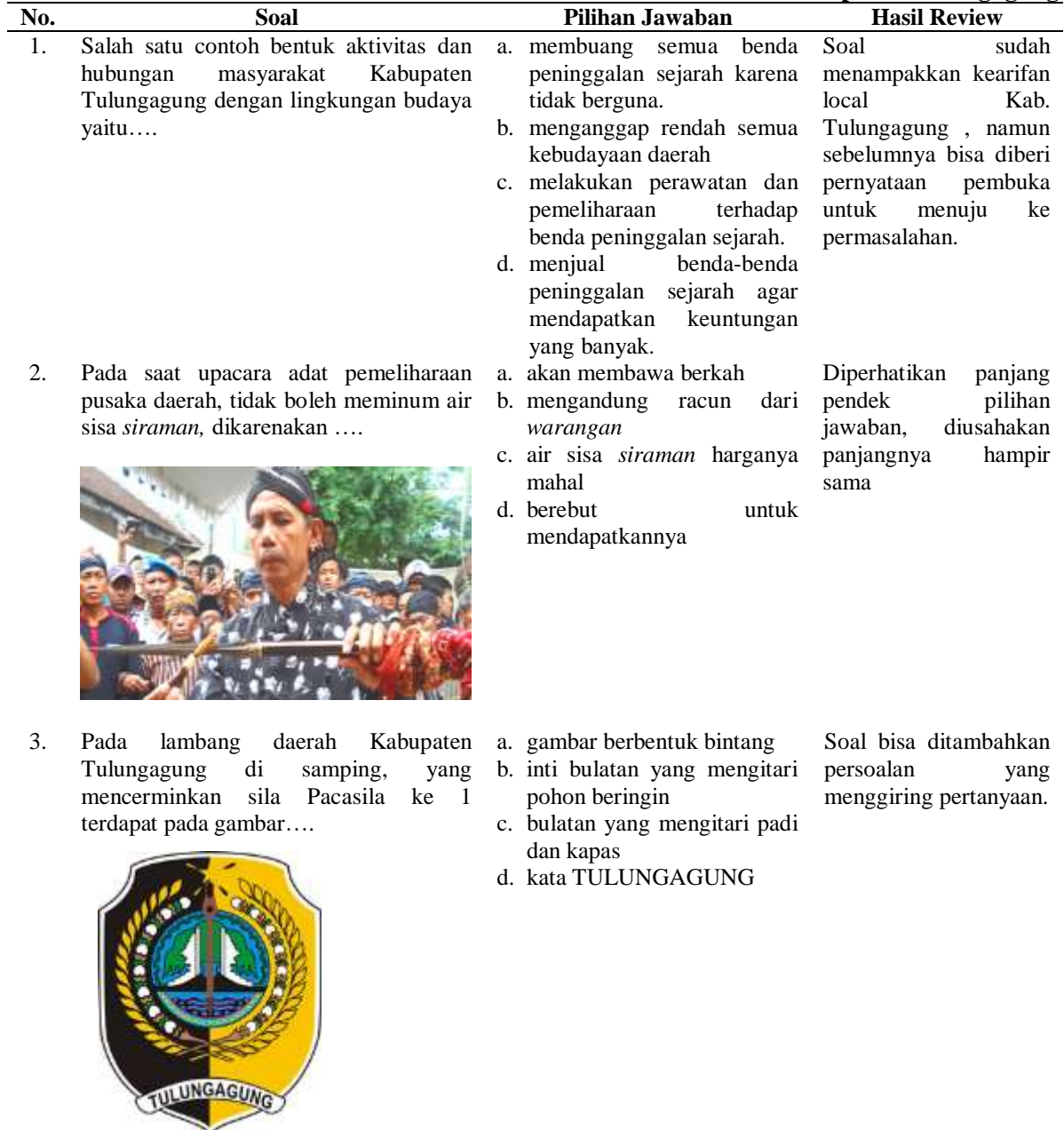
Tabel 5. Contoh Hasil Review Soal HOTS Berbasis Kearifan Lokal Kabupaten Tulungagung

perbaikan dari soal yang sudah dibuat. Berikut beberapa contoh soal HOTS berbasis Kearifan Lokal Kab. Tulungagung.