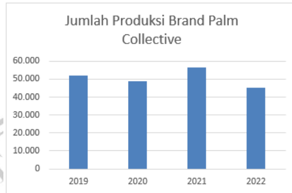
Gambar 1.2 Grafik Jumlah Produksi Perusahaan

karyawan akan cenderung menyepelekan SOP yang berdampak pada penilaian kedai oleh pengunjung.