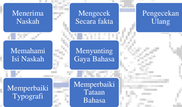
Gambar 28. Alur menyunting naskah dari segi kebahasaan

Inara Publisher memprioritaskan peningkatan aspek tipografi dalam proses penerbitan. Penerbit memastikan bahwa huruf, spasi, dan elemen-elemen tipografi lainnya disusun sesuai dengan standar publikasi, menciptakan pengalaman membaca yang profesional dan menyenangkan bagi pembaca. Melalui penelitian yang teliti, struktur bahasa naskah juga diperhatikan dengan baik, termasuk penyusunan paragraf, pengembangan alur cerita, dan pemilihan kata-kata yang mendukung pesan penulis. Inara berkomitmen untuk menyajikan karya tulis berkualitas tinggi kepada pembaca dengan mempertahankan standar penerbitan yang tinggi melalui perbaikan tata bahasa, tipografi, dan struktur bahasa.