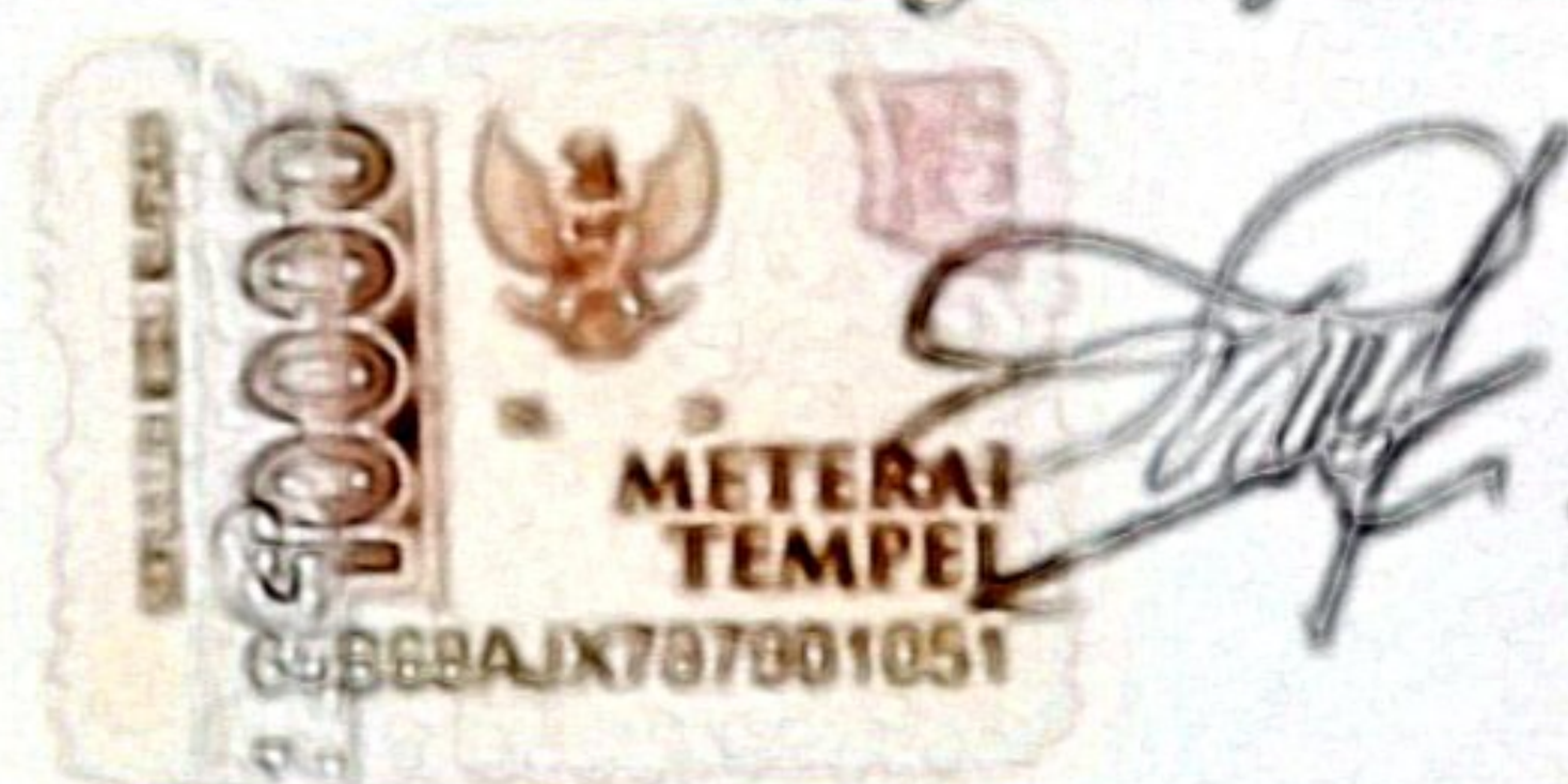
Salsabila Nur Haliza