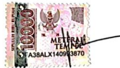
Fairuz Jaudah Nabila