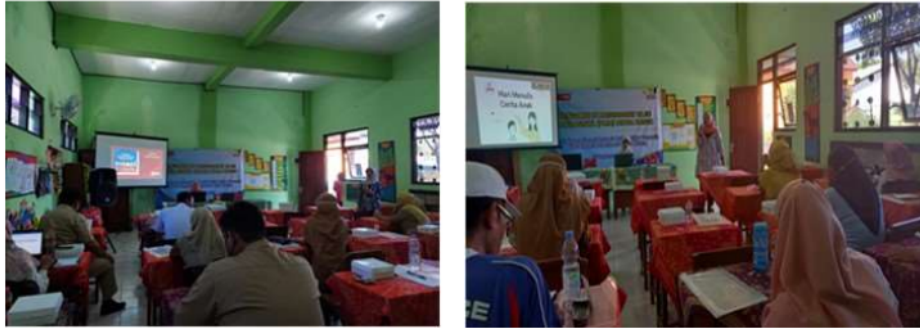
Gambar 3. Penyampaian materi ke 1 (Profil Pelajar Pancasila) dan Penyampaian materi ke 2 (Menulis Cerita Anak)

Materi yang ke 2 terkait Menulis Cerita Anak. Materi yang ke 2 ini sangat penting untuk memberikan wawasan kepada guru agar mengenal lebih jauh terkait bagaimana cara menulis anak dan menghasilkan tulisan cerita anak yang dapat menambah referensi siswa dalam kegiatan literasi. Kegiatan workshop ini dilanjutkan dengan sesi tanya jawab terkait materi yang telah diberikan, sesi tanya jawab penting dilakukan sebagai bentuk interaksi aktif antara pemateri dengan peserta workshop . Para guru terlihat sangat antusias untuk mencoba menulis cerita anak. Penyampaian materi tersebut dapat dilihat dalam gambar 3.