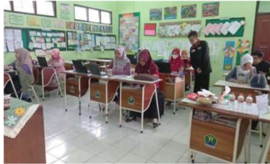
Gambar 6. Reviu Kerangka Cerita Anak

ada beberapa yang perlu diperbaiki seperti keterkaitan antar paragraf belum runtut, topik cerita yang masih kurang sesuai, dan integrasi profil pelajar Pancasila yang belum difokuskan. Terlihat manfaat kegiatan reviu ini untuk memberikan informasi yang perlu diperbaiki untuk menghasilkan suatu karya yang berkualitas. Peningkatan kualitas membutuhkan waktu yang tidak singkat dan perlu adanya keberlanjutan dalam proses peningkatan seperti workshop dan pembimbingan (Dzikrullah et al., 2020).