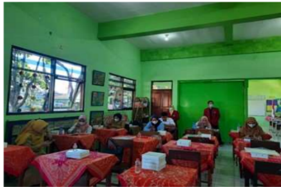
Gambar 4. Guru Mengerjakan Post test

Setelah kegiatan penyampaian materi dan tanya jawab, kemudian guru diberi soal post test . Soal ini bertujuan untuk mengukur pemahaman guru setelah mendapatkan materi dan berdiskusi dengan pengabdian. Sehingga, guru dapat mengerjakan sesuai dengan pemahaman mereka setelah materi disampaikan.