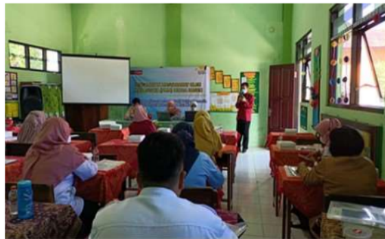
Gambar 1. Pembukaan PMM Mitra Dosen bersama Kepala Sekolah, Mahasiswa, dan Dosen.

Setelah pembukaan, acara pengabdian dilanjutkan dengan pre test . Pre test ini dilakukan dengan memberikan soal kepada guru melalui google form terkait materi profil pelajar Pancasila dan penulisan cerita anak. Pre test ini bertujuan untuk mengukur pemahaman awal guru berkaitan dengan materi yang disampaikan, pemberian pre test dapat mengetahui sejauh mana pengetahuan guru tentang materi yang akan disampaikan (Donuata, 2019). Berikut merupakan hasil dari pre test yang dihasilkan oleh para guru dengan tampilan grafik pada gambar 2.