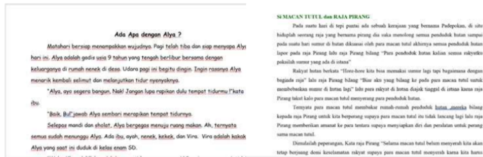
Gambar 8. Draf Cerita Anak

Cerita anak yang dihasilkan oleh para guru setelah dilakukan reviu didalamnya sudah mengandung profil pelajar Pancasila. Dimensi profil pelajar Pancasila yang ada didalam cerita anak terdiri atas 1) dimensi beriman, bertakwa kepada Tuhan YME, dan berakhlak mulia; 2) Mandiri; 3) Bernalar Kritis; 4) Kreatif; 5) Bergotong Royong; 6) Berkebinekaan Global. Dimensi profil pelajar Pancasila tersebut dapat dijadikan oleh guru diintegrasikan dalam kegiatan literasi maupun dalam proses pembelajaran dengan harapan, peserta didik dapat belajar dari cerita anak dengan sisi positif dari profil pelajar Pancasila dapat diimplementasikan dalam kehidupan sehari-hari. Peserta didik akan merasa bangga membaca cerita anak yang dibuat oleh gurunya. Sehingga dari cerita anak yang telah dibuat oleh guru akan menstimulus peserta didik untuk bisa membuat cerita anak sebagai suatu kegiatan proyek yang dapat melatih peserta didik untuk menghasilkan suatu karya.