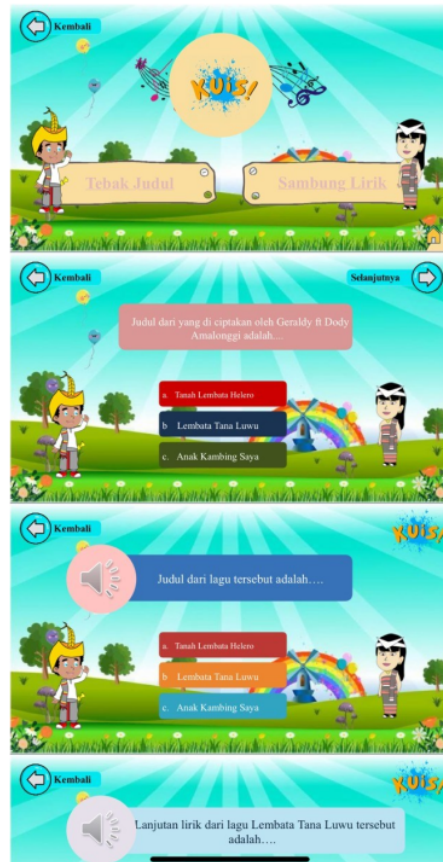
Gambar 2. Media Pembelajaran Digital Berbasis Permainan Tebak Lagu

Peruntukan cara penyampaian langsung berkebalikan dengan cara modifikasi dengan permainan, yaitu untuk peserta didik kelas tinggi. Peserta didik kelas tinggi sudah mampu berkonsentrasi dengan rentangan waktu yang lebih lama dari peserta didik kelas rendah. Hal ini menjadikan penyampaian menggunakan cara langsung lebih efektif dan sesuai.