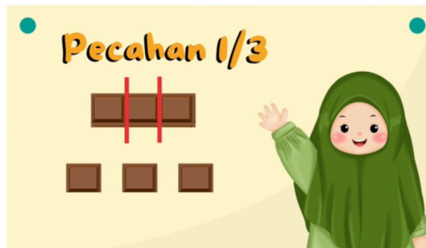
Gambar 3. Konstruk Media Pembelajaran Digital

Dari hasil observasi dan angket didapatkan bahwa media pembelajaran digital yang dikembangkan oleh mahasiswa PGSD sudah memuat grafis, visual, audio, video. Namun belum semua media pembelajaran digital yang dikembangkan menggunakan prinsip interaktif. Dari 10 responden, hanya empat responden yang media pembelajarannya bersifat interaktif dan dapat dioperasikan baik oleh guru dan peserta didik. Enam media pembelajaran digital lain yang dikembangkan belum menggunakan prinsip interaktif. Media pembelajaran digital yang dikembangkan cenderung hanya memaparkan materi dan berisi animasi bergerak maupun tidak bergerak.